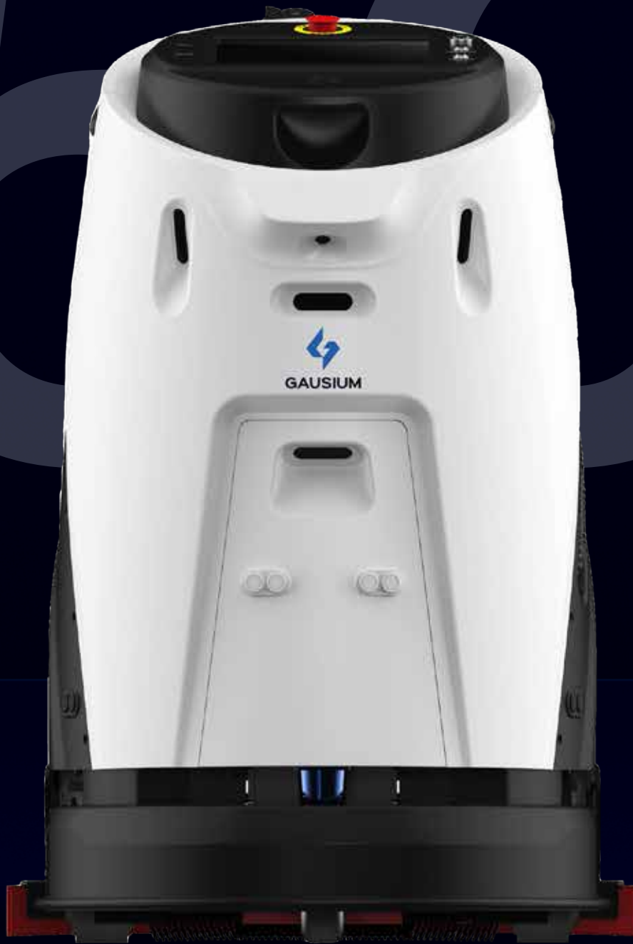
Scrubber 50 Pro Autolaveuse de sol robotisée alimentée par l'IA